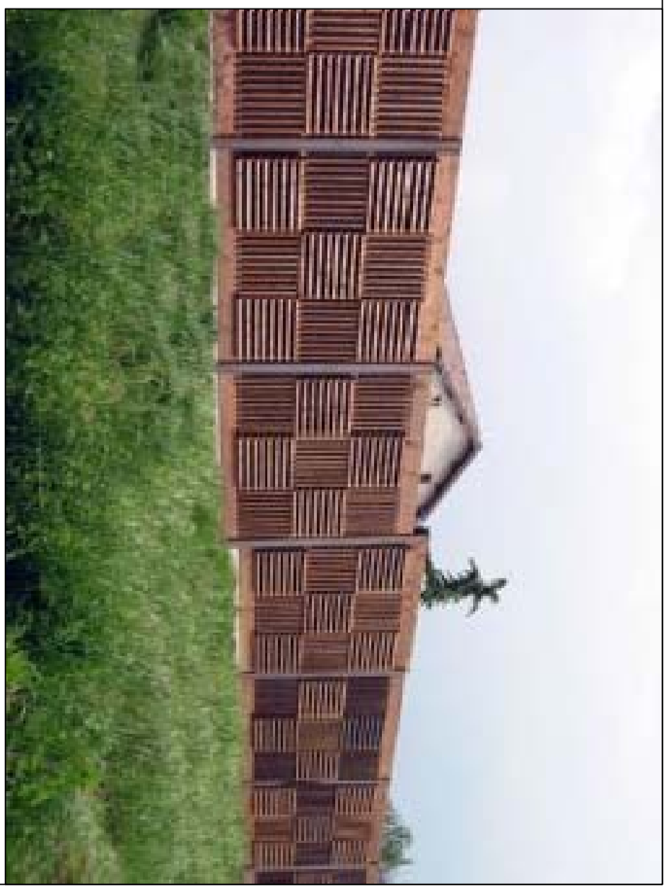
Barriera antirumore: pannellatura cieca in legno ( tipo B ) H. ml 4,00